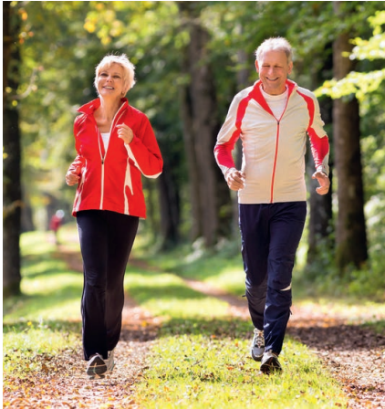
Vektor-Resveratrol hält auch im höheren Alter fit