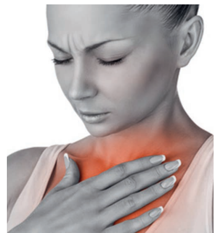
Sodbrennen ist äußerst unangenehm.

Hartnäckig hält sich der Irrglaube, Sodbrennen sei ein Problem von zu viel Magensäure. Dabei ist das Gegenteil der Fall! Denn ohne Magensäure gärt die Nahrung im Bauch, es bilden sich Gase, die den sauren Mageninhalt die Speiseröhre hochdrängen und für Sodbrennen sorgen. Vektor-HCL erhöht die