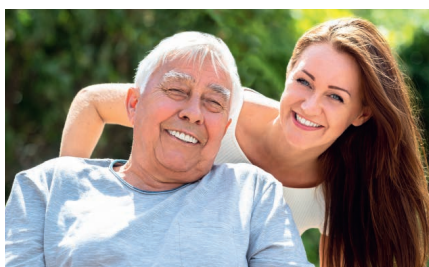
Entgiftet lebt es sich gleich freudvoller!

Körper und Seele hängen eng miteinander zusammen: Kämpft ersterer mit Alltagsgiften (was sich kaum vermeiden lässt), belastet das auch die Psyche. Und das ist mehr als eine gefühlte Wahrheit. In der Leber etwa werden all die Substanzen gebildet, die der Körper zur Produktion von Glückshormonen benötigt. Dazu gehören z.B. Serotonin oder 5-HTP.