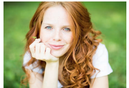
Natürlich schön mit Vektor-Produkten

Vektor-Beauty-Skin hat die Bestell-Nummer 22050, 100 Kapseln für 33 Tage kosten im November 39,90 € statt 49,90 €.