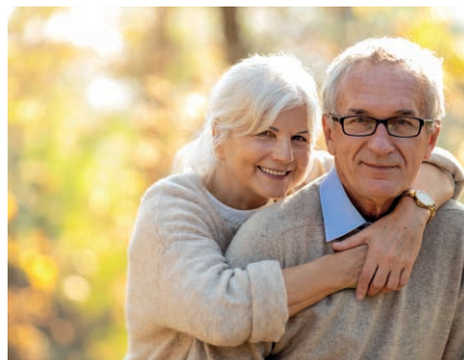
Gesund durch den Winter – mit Vektor-LipoC!

Die 125-ml-Flasche Vektor-LipoC hat die Bestell-Nummer 50090 und kostet im November nur 69,80 € statt 79,80 €.